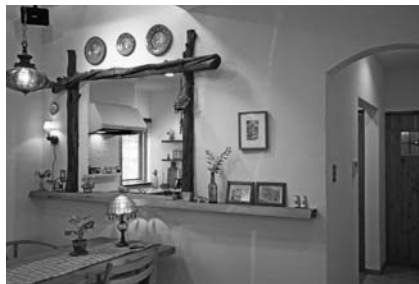
▲自然住宅のインテリア