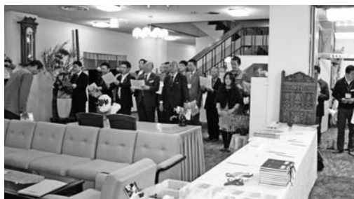
11月24日のモーニングセミナー役員朝礼風景。 「ハイ」の実習で30名を超える「ハイ」の返事が聞こえた。