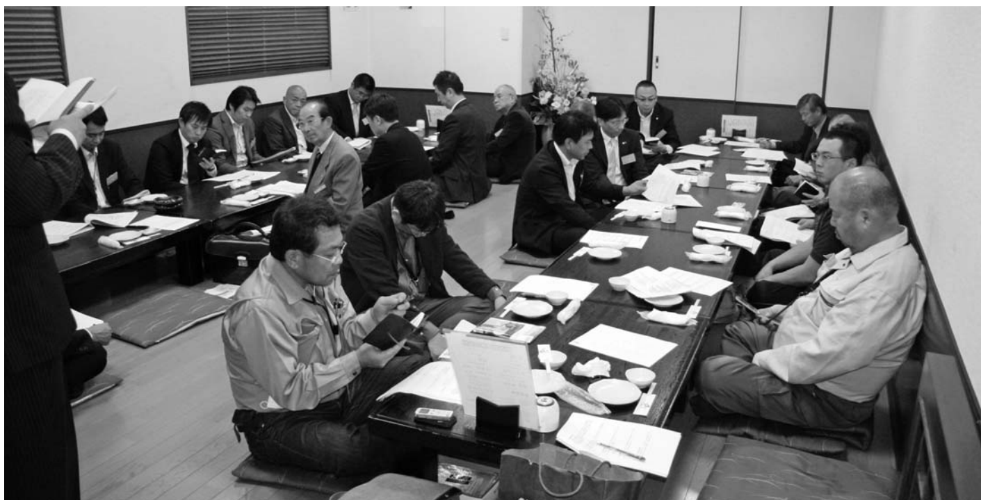
▲11月12日(土)ラ・ナラで開催された高松南倫理法人会新入会員オリエンテーション。

皆様と絆を深め一歩ずつ前へ進んでまいりますので、今後とも、ご指導、ご鞭撻の程よろしくお願い申し上げます。