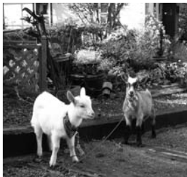
▲当社のペット ミニ山羊

▲当社のペット ミニ山羊 存在を知り、私自身もいつの間にか化学物質過敏症になっていたのです。そんな事からシックハウスについて追求し勉強をしていくと自然素材(無垢材、漆喰など)の素晴らしさ、それは機能面だけではなく、古くなくても味わいが出る…むしろ、古くなるのを楽しめるという事を知り、平成9年より自然素材を使った家づくり、「自然住宅」弾(建築業)をスタートいたしました。