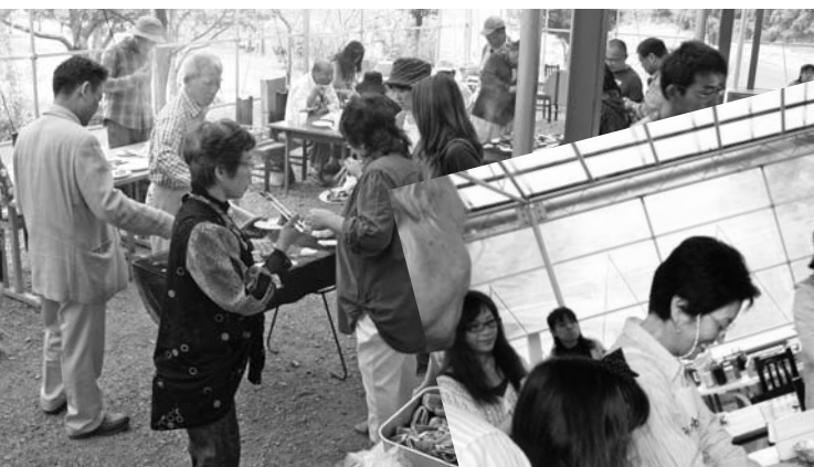
▶ 大好評だったピザづくり体験。多くの参加者が自分で作ったピザを食べました。