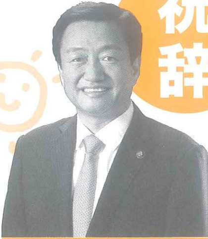
高松市長 大西 秀人